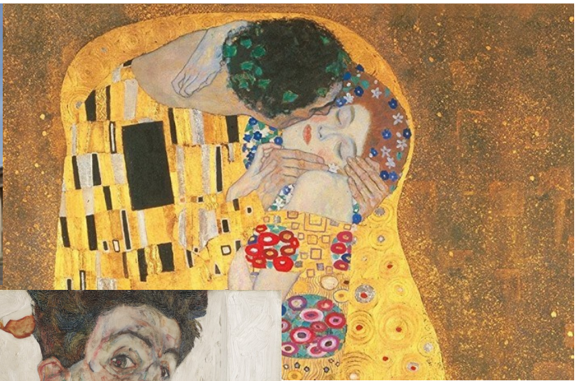
Stefan Zweig Œuvres complètes